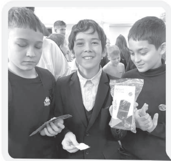
Все участники беспроигрышной лотереи ушли домой с призами