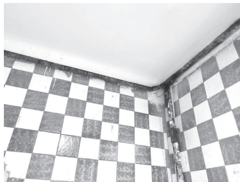
Подрядчик заменит и обветшавшие коммуникации комплекса. Обновление коснётся труб подачи воды и отопления

крытие выполнено в два слоя, что позволит избежать быстрого износа и сохранит привлекательный внешний вид помещений на долгие годы.