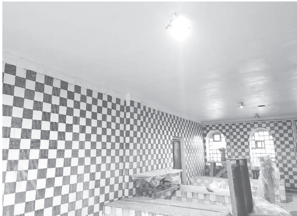
Потолки бани до ремонта представляли собой печальное зрелище. Теперь они сияют белоснежной чистотой.