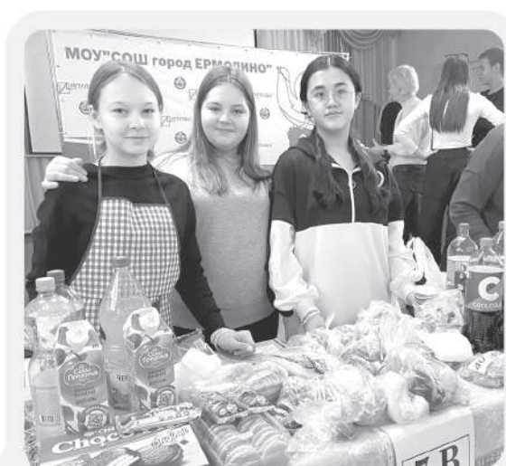
Ассортимент на прилавках поражал своим разнообразием – от домашней выпечки до ароматной косметики ручной работы

Результаты проведённой в ермолинской школе благотворительной ярмарки впечатляют. Общими усилиями в поддержку бойцов специальной военной операции удалось собрать 217 тысяч рублей