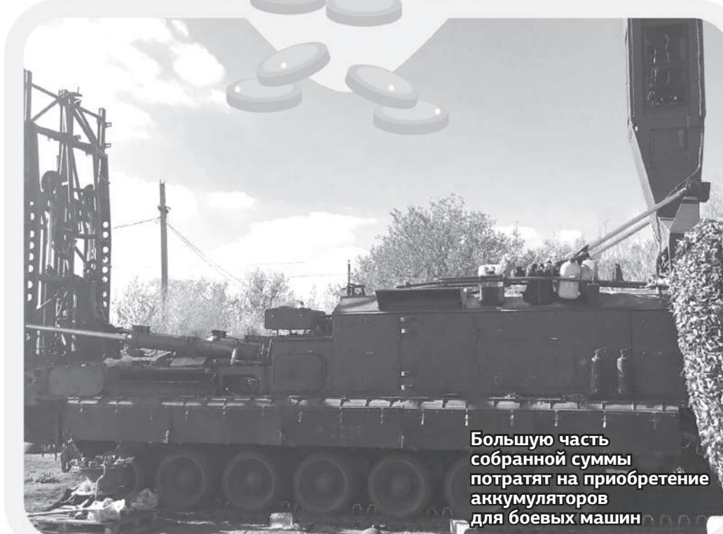
Большую часть собранной суммы потратят на приобретение аккумуляторов для боевых машин