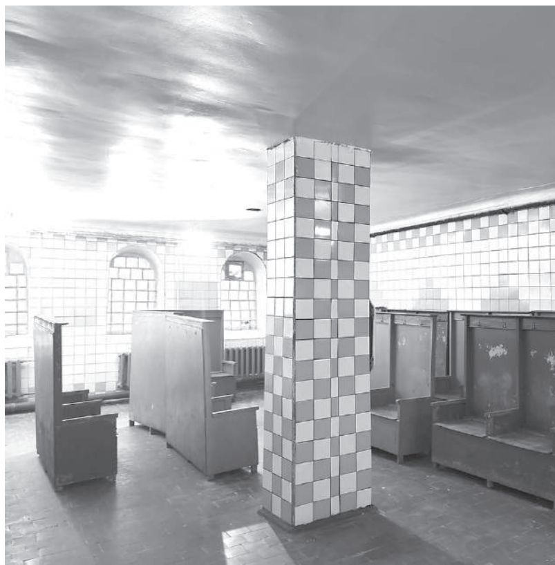
Потолки в раздевалке покроют двойным слоем краски