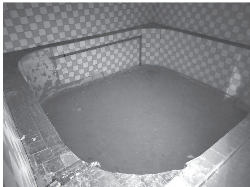
После ремонта горожане наконец смогут воспользоваться бассейном комплекса

Подрядчик уже завершил покраску потолков в помывочной и раздевалке. Для обеспечения долговечности и надежности по-