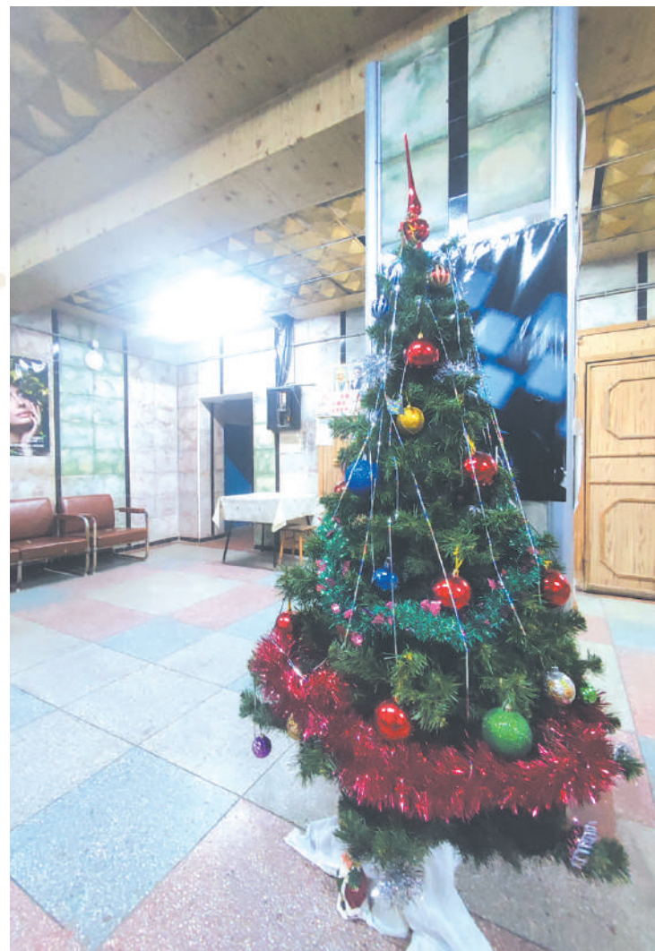
В следующем году «Теплосети» надеются заменить потолки в холле