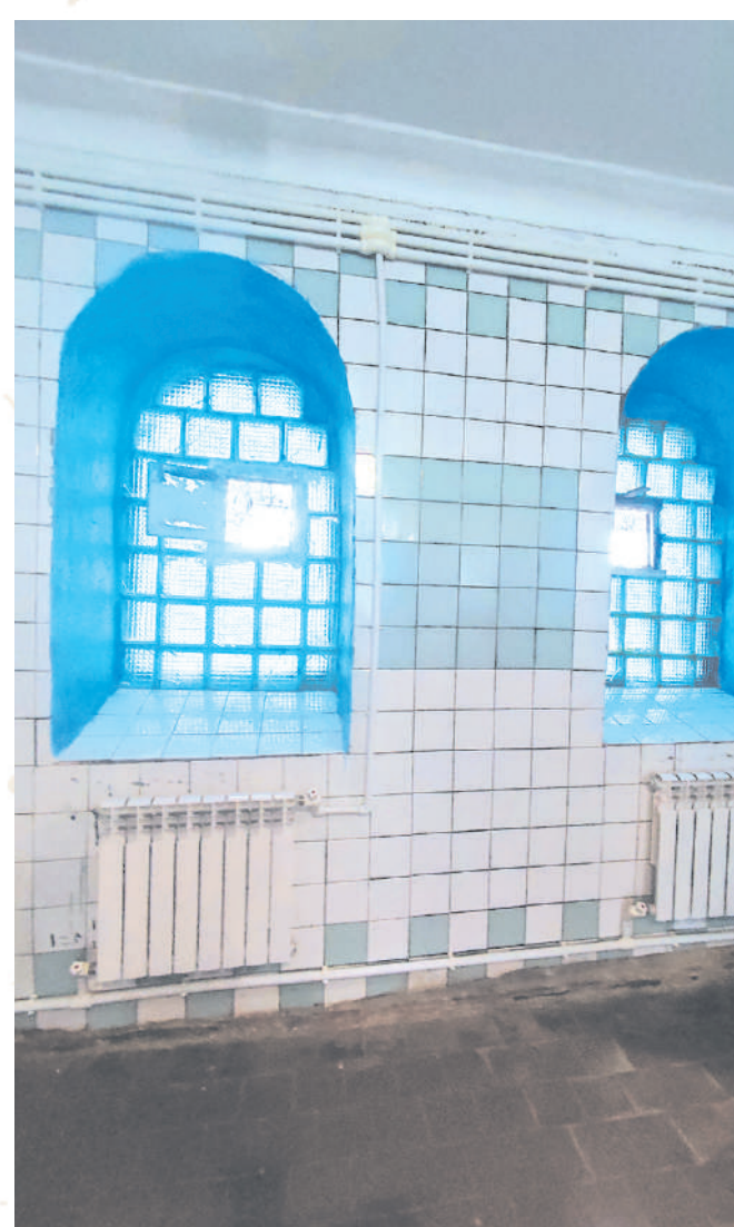
Есть планы по замене окон и дверей

Было/стало в раздевалке. Не хватает только новой мебели