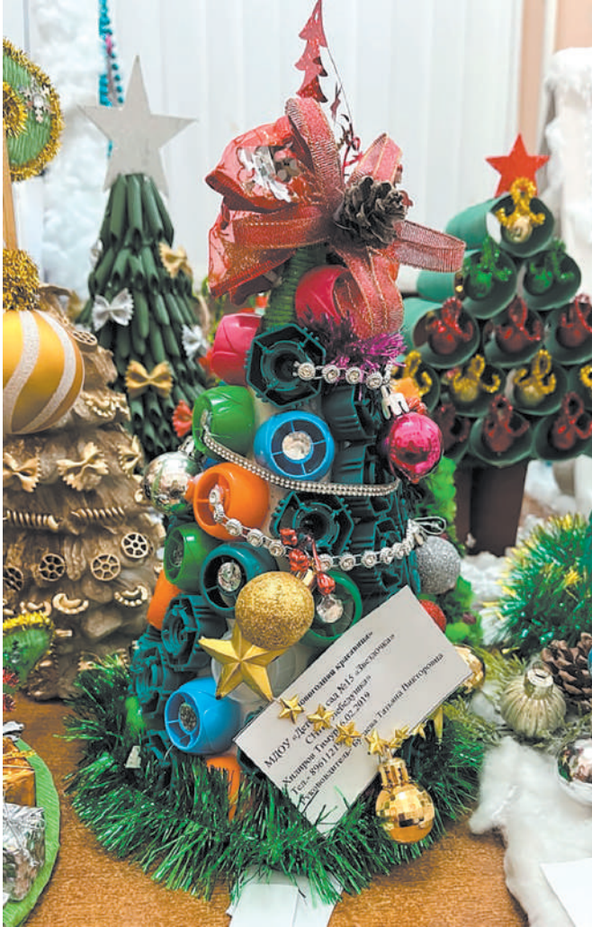
Пожалуй, самая креативная идея – сделать елку из крышечек от пюре

Более ста праздничных ёлочек на некоторое время «поселились» в ермолинской «Гармонии». В городском филиале социального учреждения провели конкурс «Новогодняя красавица»