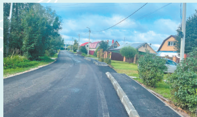
Асфальт уложили и на улице Кооперативной