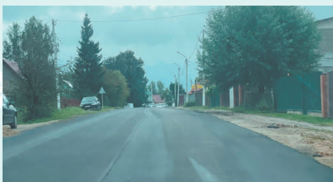
Головная боль руководства города и жителей улица Ленина приведена в полный порядок