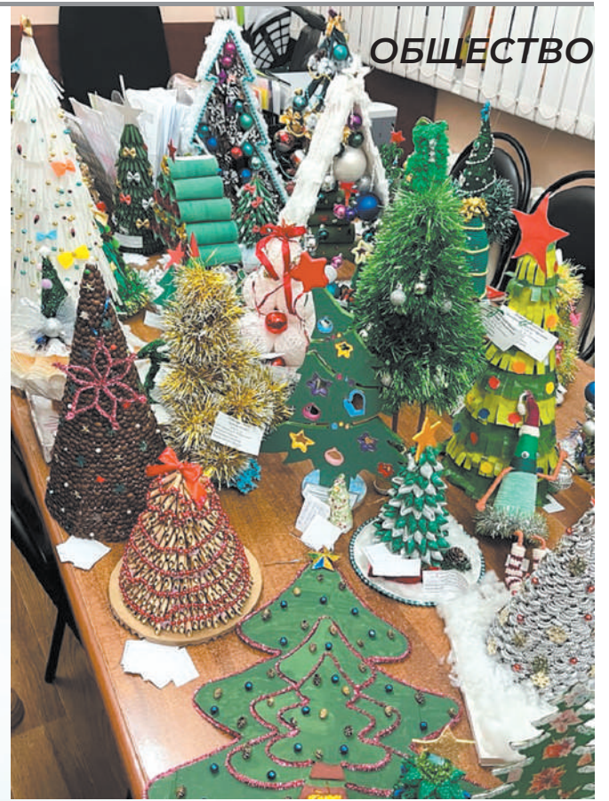
От бумаги до макарон – настолько разные материалы выбрали участники конкурса для изготовления новогодних поделок

«Выбор победителей дался нелегко. Ведь каждая работа по-своему уникальна и показывает нам, чем ребёнок увлекается. Квиллинг, вязание, вышивка, выжигание – это малая часть техник, в которых выполнены новогодние ёлочки. Все участники – огромные молодцы!» – отметили в ермолинской «Гармонии».