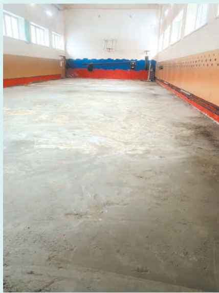
В спортзале стадиона "Труд" ремонтируют полы

Состояние сетей, пожалуй, основная головная боль любого руководителя муниципалитета. В силу изношенности труб аварийные ситуации в системах тепло- и водоснабжения приносят жителям немало проблем. Говорить, что в Ермолине ситуация удовлетворительная, конечно, преждевременно, но работа в этом направлении ведется. Ежегодно проводится замена проблемных участков труб. И уходящий год в этом отноше-