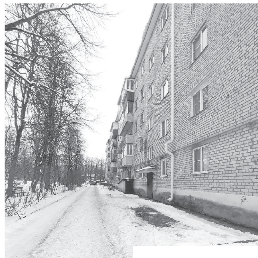
Эта придомовка у дома № 7 на площади Ленина давно требует ремонта. Возможно, там появится новый асфальт и скамейки