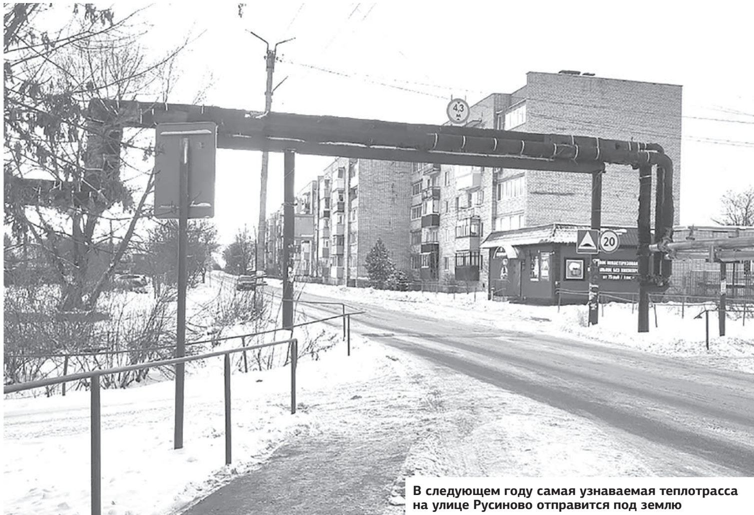
В следующем году самая узнаваемая теплотрасса на улице Русиново отправится под землю

В Ермолине вплотную подошли к передаче теплового имущества концессионеру