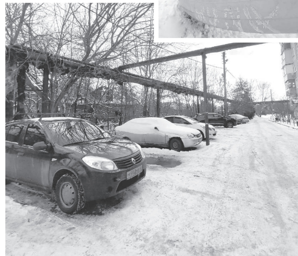
В 2025-м возле дома № 214 по улице Русинова линию теплоснабжения полностью обновят и спрячут под землю. В печали только котики, которым негде будет греться

В следующем году по программе «Комфортная городская среда» между домами № 2, 4, 6 на Советской на первом этапе заасфальтируют дорожки и тротуары, подготовят основание для площадки и смонтируют фонари